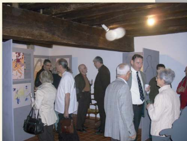
Inauguration de l'exposition Jean Calvin & le Béarn.