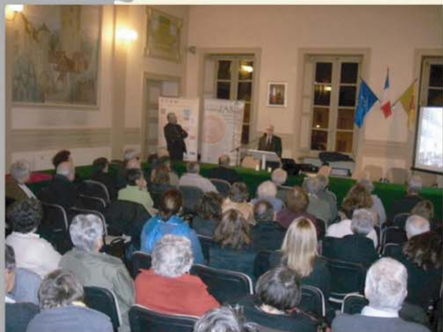
Conférence de Raymond MENTZER à l'Hôtel de Ville, le 13 février 2009