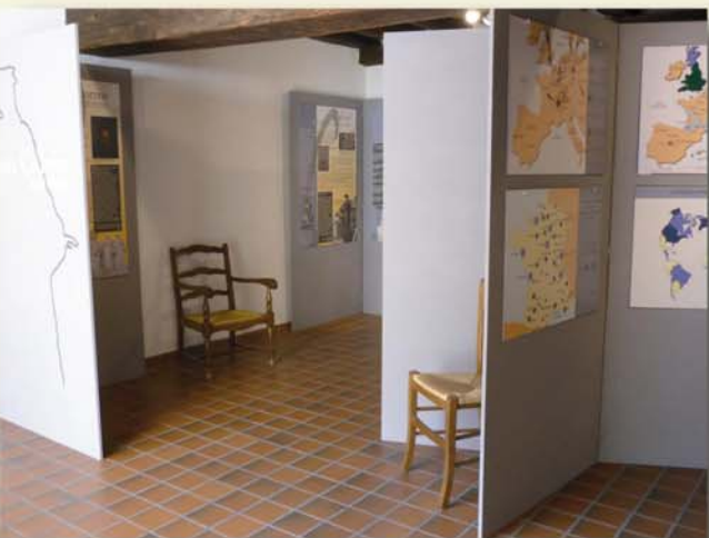
Vue partielle de l'exposition temporaire Jean Calvin & le Béarn